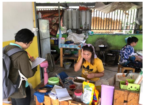
ภาพที่ 3 ลงพื้นที่เก็บข้อมูล และสำรวจข้อมูลภาคสนาม