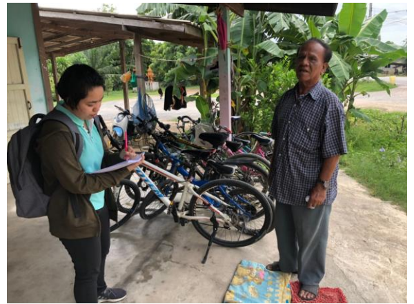
ภาพที่ 4 ลงพื้นที่เก็บข้อมูล และสำรวจข้อมูลภาคสนาม