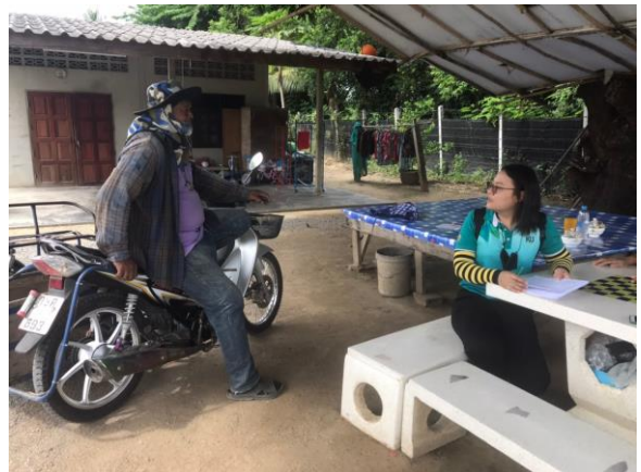
ภาพที่ 5 ลงพื้นที่เก็บข้อมูล และสำรวจข้อมูลภาคสนาม