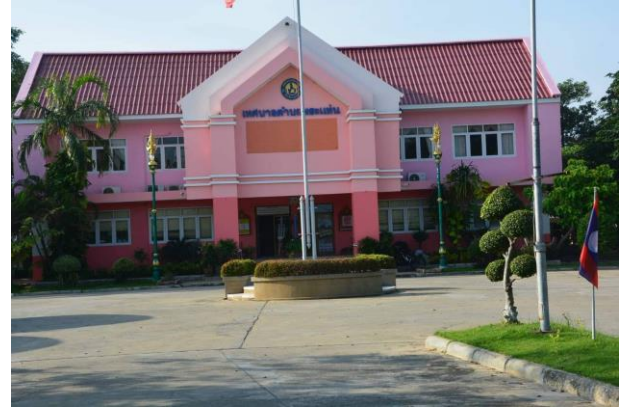
ภาพที่ 1 เทศบาลตำบลพระแท่น