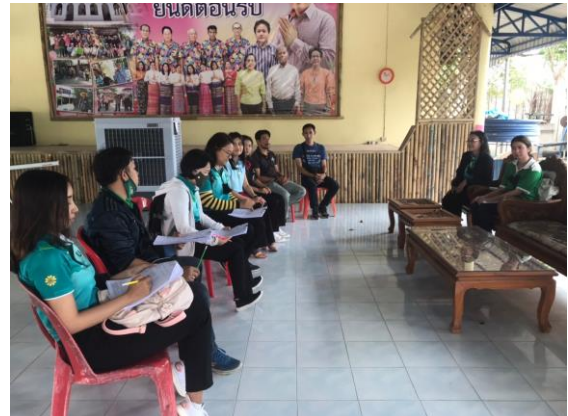
ภาพที่ 2 พบผู้ประสานงานเพื่อชี้แจงรายละเอียดการสำรวจข้อมูล